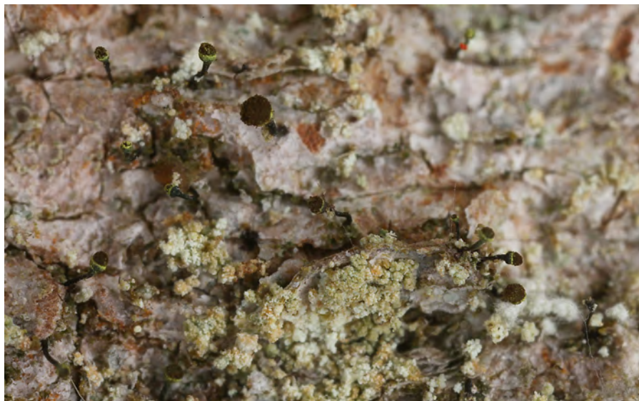
Obr. 3. Chaenotheca laevigata – Šumava, Modravské slatě.