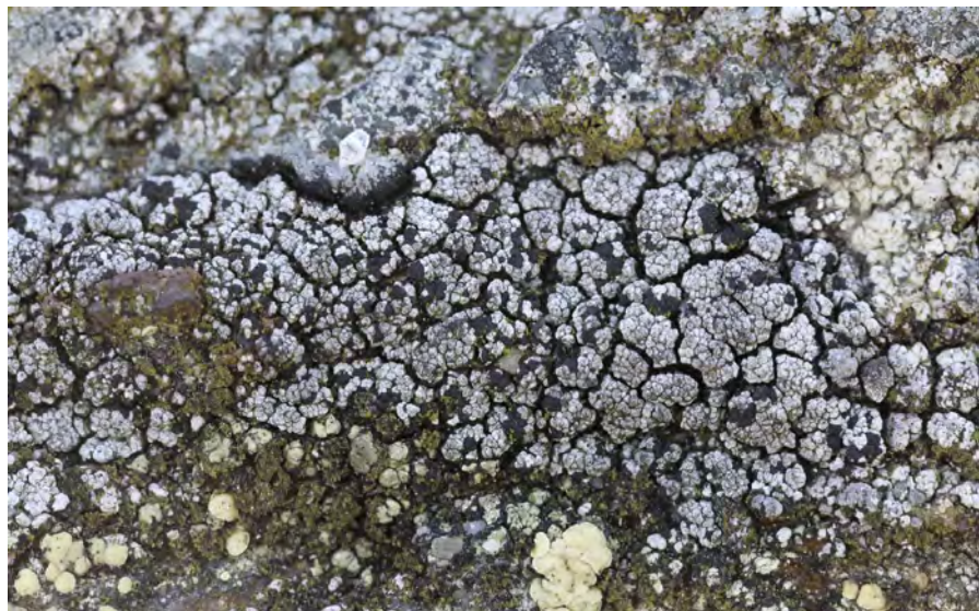
Obr. 5. Miriquidica pycnocarpa – Šumava, kar Černého jezera.