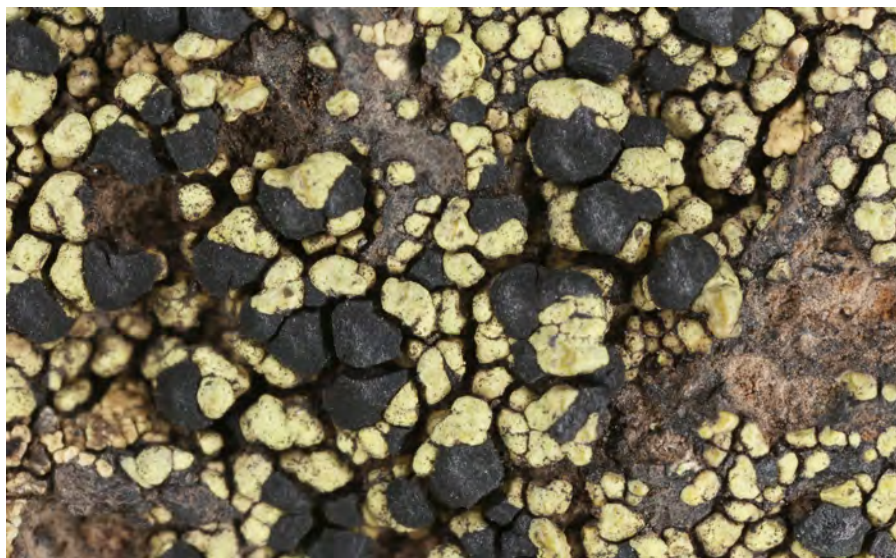
Obr. 8. Rhizocarpon viridiatrum – Itálie.