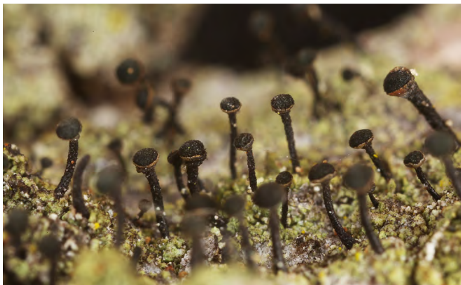
Obr. 2. Calicium viride – Šumava, Stožec.