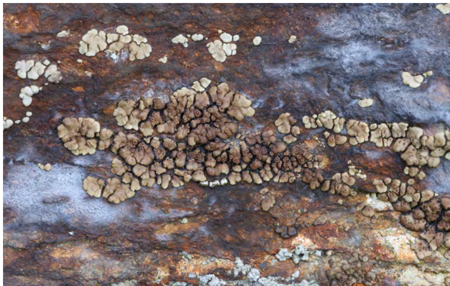
Obr. 1. Acarospora rugulosa – Krušné hory.