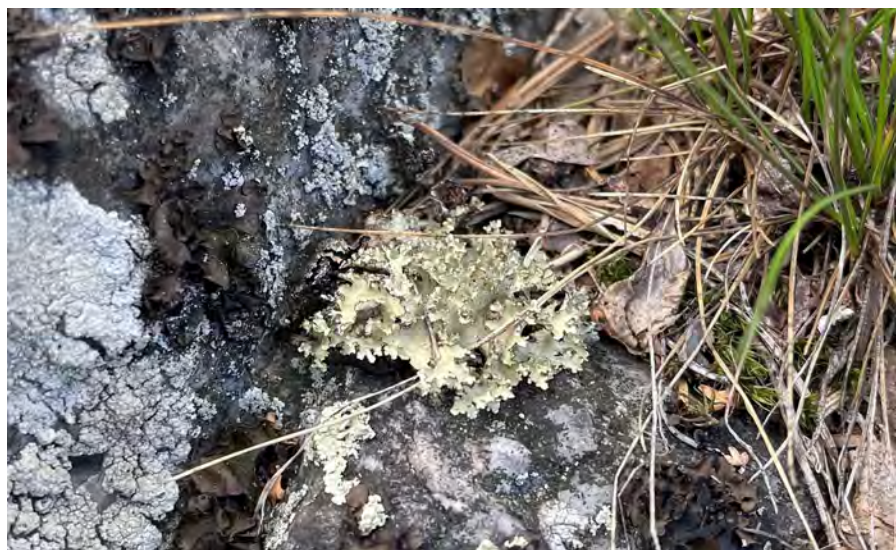
Obr. 6. Nephromopsis laureri – Brdy, hřeben Florián.