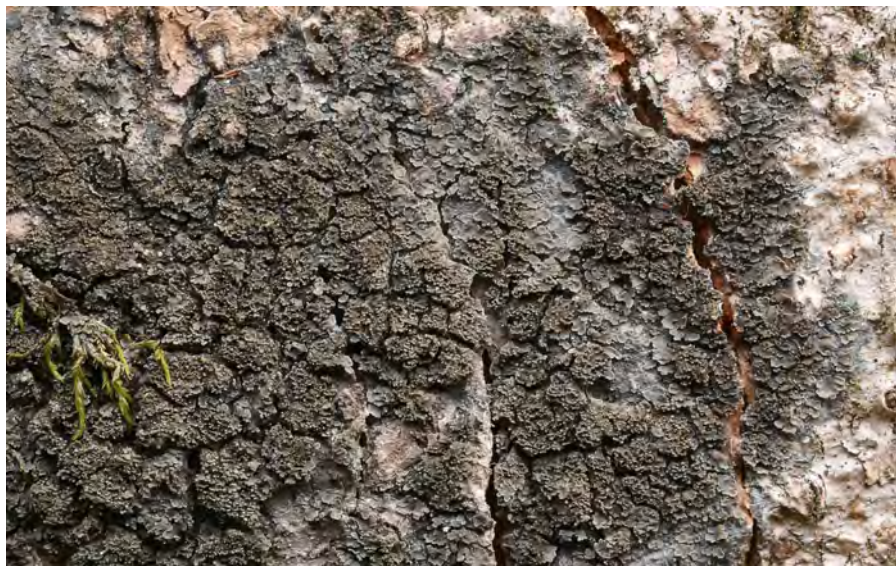
Obr. 7. Parmeliella triptophylla – Šumava, Jezerní stěna.